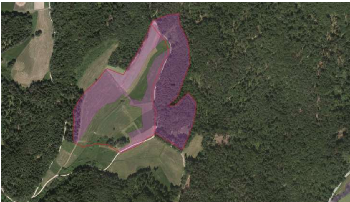
Slika 2: Prikaz zahtevanega zmanjšanja predlaganega turističnega območja Slatine, predloga št. 207 in 208 na osnovi zahtev izhajajočih iz CPVO (prikaz na DOF, vir: Matrika ZVO, okoljsko poročilo, 2017, poglavje omilitveni ukrepi).