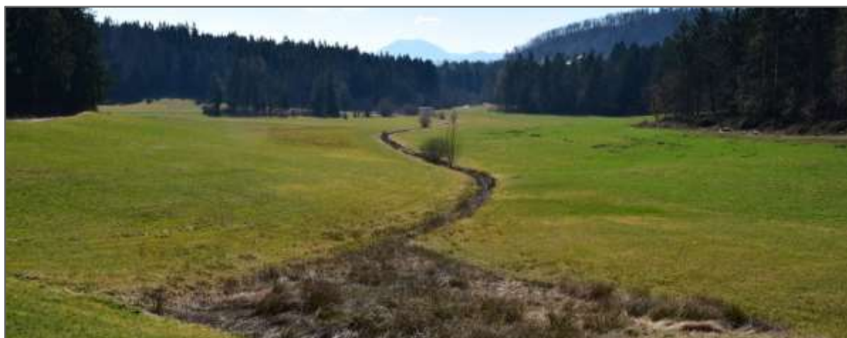
Slika 5: Se lahko današnja prepoznavna podoba z novimi dejavnostmi ohrani in morda celo razvije?.

Izhodiščna ideja naročnika je, da se v območje Slatin umešča naravi prijaznejše oblike turizma, ki bi se povezale s ponudbo raznolikih dejavnosti na celotnem območju občine Polzela. Vnašanje nove gospodarske dejavnosti v območje, ki je z izjemo obstoječih primarnih dejavnosti (kmetijstvo in gozdarstvo) prostor brez drugih človekovih posegov, je v osnovi problematično. Zato je skozi postopek izdelave teh strokovnih podlag ter nastajajočih sprememb in dopolnitev veljavnega OPN potrebno najprej jasno odgovoriti na vprašanje ali je turistična dejavnost v tem območju sprejemljiva in natančno določi pod kakšnimi pogoji. Umeščanje 'glampinga' v območje, kjer so danes le kmetijske površine in gozd in še neraziskan izvir mineralne vode vzbujata tudi načelne dileme, četudi je območje Slatin že dolgo v planih opredeljeno kot potencialno turistično območje. Hkrati pa je razvoj turizma tudi priložnost, da se prostor izloči iz območja intenzivnejšega kmetijstva (travniki so zaradi kmetijstva povsem osiromašeni) in morda na ta način najde pot do vzpostavitve 'naravnejšega' stanja; gozd je v gospodarskem smislu slab, kakšen 'zagon' potrebuje za novo rast; Prostor je zanimiv, zaprt, miren,... kakšno dejavnost lahko prenese?