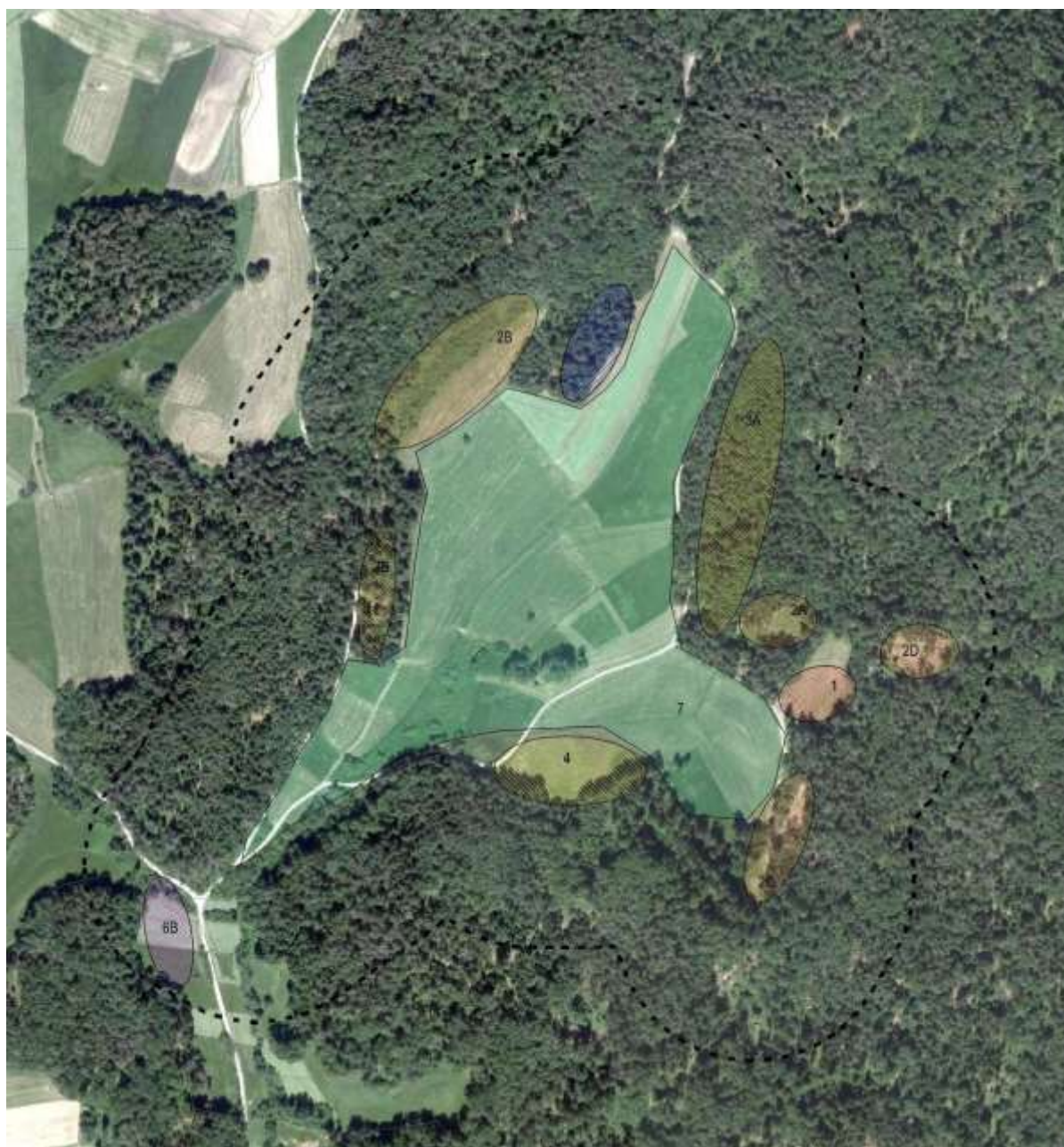
Slika 4: Koncept možne zasnove bodoče rabe prostora – 1 = recepcija/vstopni del, 2 = hiške na kolih, 3 = hiške na drevesih/kolih, 4 = šotorišče, 5 = opazovališče/počivališče, 6 = pogojno (!) parkirišče, 7 = območje brez posegov (izris iz grafičnih prilog tega dokumenta).

Zasnova (slika 44) sledi osnovnim konceptualnim usmeritvam (poglavje 5.1, Koncept). Vsi načrtovani posegi se umikajo iz osrednjega prostora pa tudi iz območij, ki so ob vstopu v dolino vizualno izpostavljena. Posledično se vse vsebine, vključno z vstopnim delom umeščajo na robove. To sicer ne pomeni, da ne bodo vidne a se obiskovalcu nikoli ne bodo 'razkrile' vse hkrati. Na ta način bo osrednji del, ki skupaj z obrobjem predstavlja prepoznavno identiteto območja, ohranjen. Pogoj za doseganje zastavljenih usmeritev in ciljev pa je zelo omejena kapaciteta območja oz. število nastanitvenih 'objektov' ter neograjena območja.