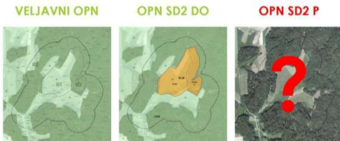
Slika 1: Namen naloge.

Občina Polzela ima že od leta 2003 v planskih dokumentih zapisano, da je dopustno raziskovanje prostora za možnosti izkoriščanja toplovodnih izvirov, od leta 2011 pa del je območja Slatin opredeljen kot samostojna enota urejanja prostora. V dopoljenem osnutku OPN, ki je bil v javni razgrnitvi, trenutno pa je v fazi sprejemanja stališč do pripomb, pa je predlagana sprememba namembnosti, ki bi omogočila razvoj turistične dejavnosti. Z namenom, da se predlagana sprememba tudi utemelji, se izdelujejo strokovne podlage. Skladno s pogodbo bodo izdelane v sedmih fazah. Za izdelavo OPN je bila uporabljena 3. faza, ki je bila posredovana nosilcem urejanja prostora (4. faza) a se ti nanjo niso odzvali. Sedaj je izdelana - 5. faza 1 (z dodatnimi analizami in simulacijami dopolnjena 3. faza), ki bo po potrditvi na strokovnem odboru Občine, ponovno posredovana nosilcem urejanja prostora za izdajo neformalnega mnenja (6. faza, SP niso obvezni dokumenti in pridobivanje mnenje nanje ni potrebno) in bo tudi osnova za zaključno, 7. fazo.